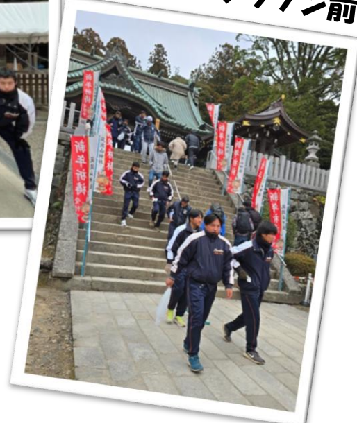
参拝後のマラソン前