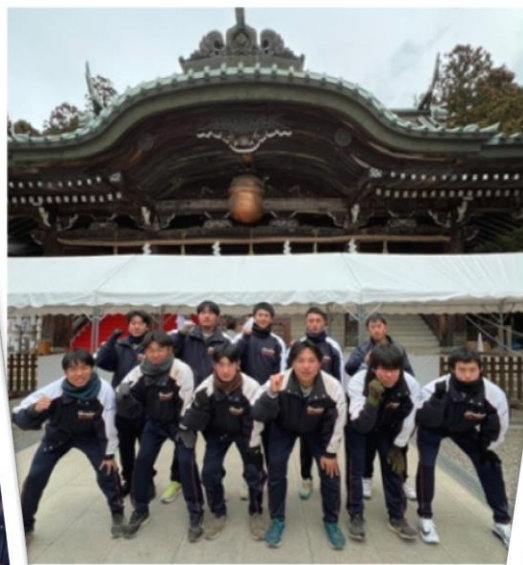
参拝前の集合写真